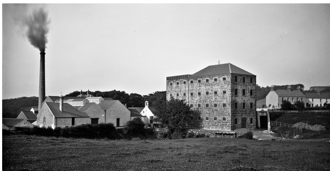
Destillerie Old Bushmills, wahrscheinlich im 19. Jhdt.